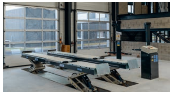
Un équipement de garage – par exemple un pont élévateur – peut être subventionné à hauteur de 70 %.